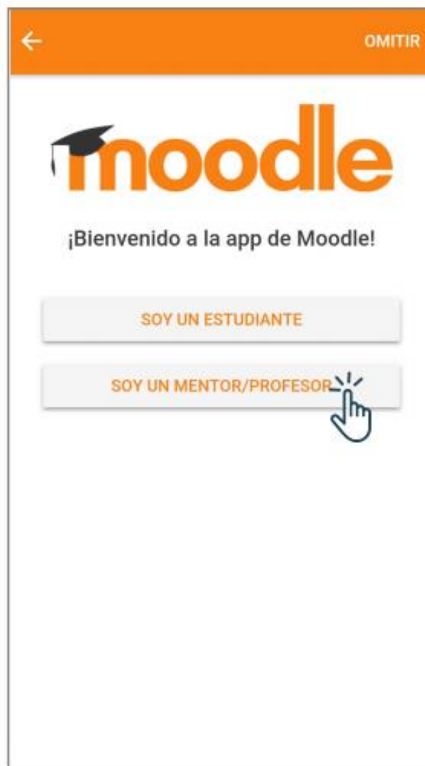
Interface del PASO 2: Opciones de perfil en Moodle. Estudiante o Profesor.