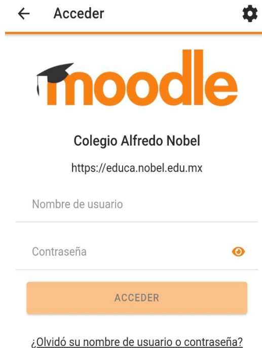
Interface del PASO 4: Campos para iniciar sesión en Moodle.

PASO 5: Una vez dentro de la plataforma se visualizarán los cursos a los que el usuario está asociado. Clicar sobre la Imagen o el Nombre del curso para acceder al ambiente virtual.